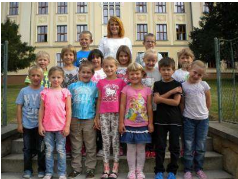
Naši noví prvňáci

Od začátku měsíce října se rozběhla výuka nepovinných předmětů, které si žáci mohou zvolit podle svého zájmu. Mezi nejoblíbenější patří tradičně Pohybové a sportovní aktivity, Zdravotní tělesná výchova a Pěvecký sbor. Současně se také rozběhly zájmové kroužky, např. kroužek, ve kterém budou děti společně tvořit školní časopis nebo ve kterém budou „kamarádit s knížkou.“ Dále pak děti mají možnost navštěvovat Agroenvironmentální či Včelařský kroužek. Ve větší míře také škola nabízí žákům doučování.