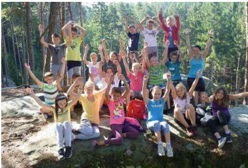
Adaptační pobyt žáků 6. třídy

Takřka po celé září přálo počasí, a tak se mohli žáci prvního stupně o velkých přestávkách vydovádět na naší rozlehlé školní zahradě. Už se moc těšíme, až na ní příští jaro vybudujeme prolézací provazovou loď se skluzavkou a altán, který bude sloužit jako venkovní učebna.